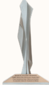
WORLD SILVER WINNER PUBLIC INFRASTRUCTURE / AMENITIES CATEGORY Flyover K.H. Noer Ali Summarecon Bekasi