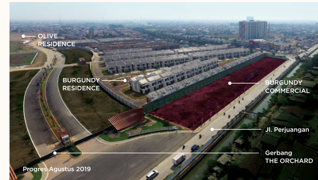
Progres Agustus 2019