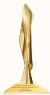
WORLD GOLD WINNER RETAIL CATEGORY Summarecon Mall Bekasi

Pengembangan kota Summarecon Bekasi telah mendapatkan pengakuan internasional dari FIABCI WORLD PRIX D'EXCELLENCE AWARDS 2017 . Sebuah penghargaan internasional tertinggi di bidang real estate yang diberikan oleh FIABCI sebagai asosiasi real estate terbesar di dunia dan menjadi consultative group tetap di PBB.