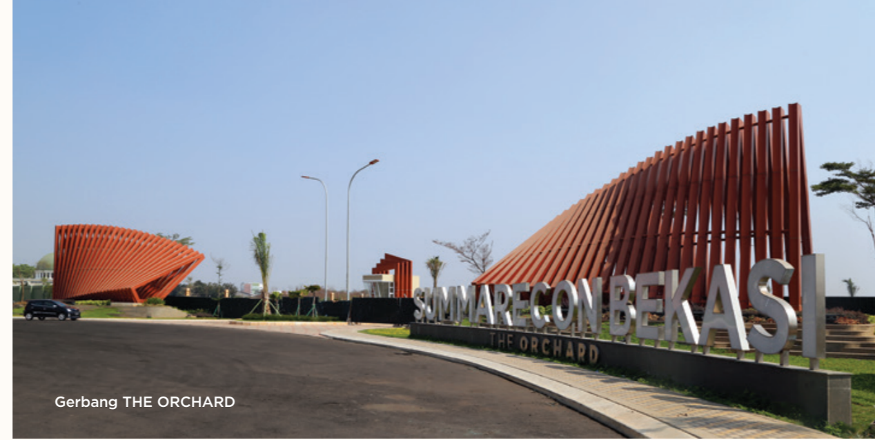
Gerbang THE ORCHARD

THE ORCHARD berlokasi di sisi utara Summarecon Bekasi dan hanya berjarak 600 meter dari pintu II Summarecon Bekasi . Prestise dan gaya hidup akan menjadi bagian tak terpisahkan dari THE ORCHARD mengingat lokasinya dekat dengan lifestyle & shopping center Summarecon Mall Bekasi dan berbagai fasilitas dan sarana umum untuk mendukung kehidupan semua anggota keluarga.