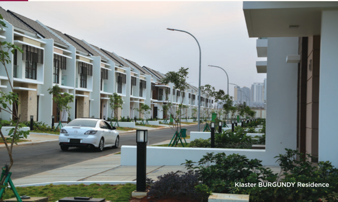
Klaster BURGUNDY Residence

Klaster disiapkan dengan jaringan infrastruktur bawah tanah (underground), keamanan 24 jam, dan jalan lingkungan lebar, serta pengelolaan Town Management yang profesional sehingga menghadirkan lingkungan cluster rumah yang nyaman untuk ditinggali oleh seluruh warga penghuni. Klaster ini sedang dalam tahap serah terima ke konsumen dan juga telah dihuni oleh warga.