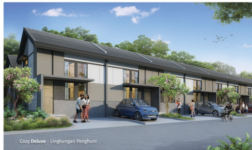
Cozy Deluxe - Lingkungan Penghuni