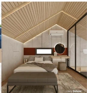
Cozy Deluxe Master Bedroom