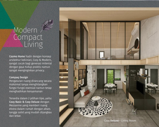
Cozy Deluxe - Living Room