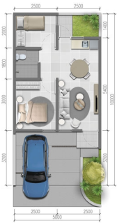
Cozy Deluxe Living Room